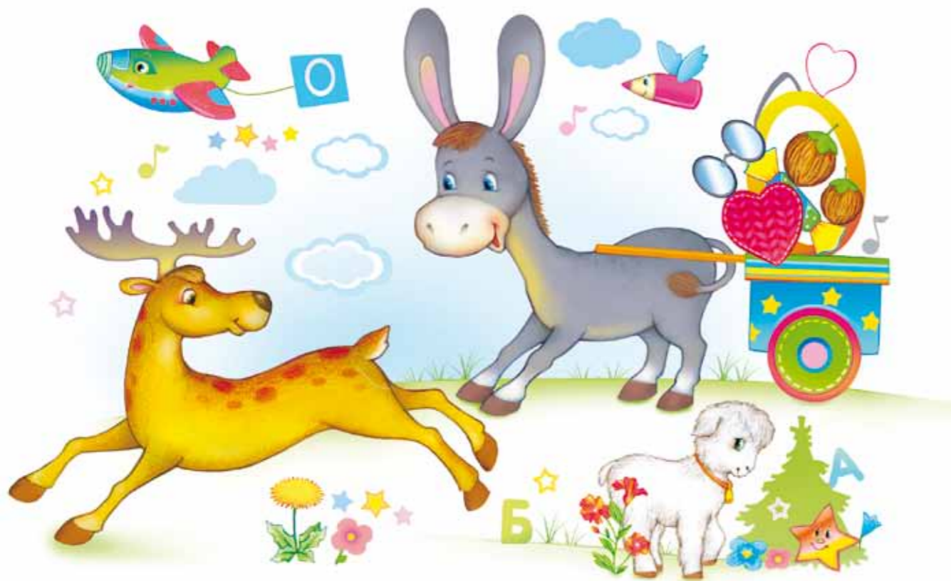
ДО ВСТРЕЧИ! ЛЮБЯЩИЙ ВАС ВСЕХ, КРОЛИК ТОЛИК

ПОБЕЖАЛ Я ЗА ЦВЕТНОЙ БУМАГОЙ И ФЛОМАСТЕРАМИ. А ПОКА МЕНЯ НЕ БУДЕТ, НАЙДИТЕ НА КАРТИНКЕ БУКВУ О.